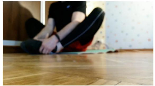
Рис. 2б. Розміщення перед камерою №2

Також у кадрі розміщується ввімкнений секундомір, або годинник таким чином, щоб було добре видно секунди та хвилини під час виконання вправ (рис. 3).