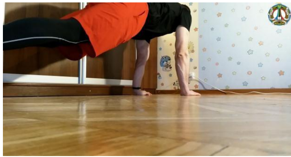
Рис. 2а. Розміщення перед камерою №2