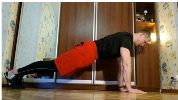
Рис. 1а. Розміщення перед камерою

Вступник заздалегідь робить відеозапис із використанням камери (за можливістю використовуються 2 камери). Камера повинна бути розташована так, щоб було добре видно усі ланки тіла, на рівні підлоги або 10-15 см від неї. Вступник повинен бути розміщений до камери боком (рис. 1а, рис. 1б).