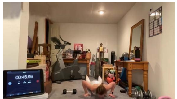
Рис. 3. Розміщення хронометра перед камерою №2

1) надати доступ до Google Діску, на якому розміщено відеозапис виконання вправ. Посилання (доступ) необхідно надіслати на електронну